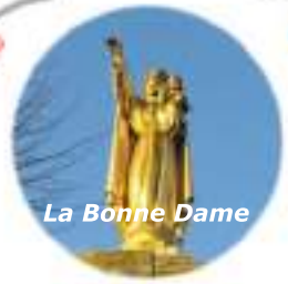
La Bonne Dame