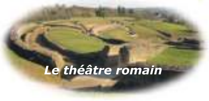
Le théâtre romain