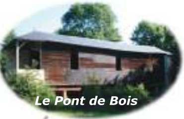
Le Pont de Bois