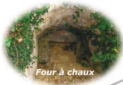
Four à chaux