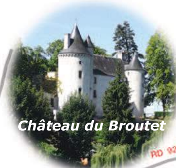
Château du Broutet